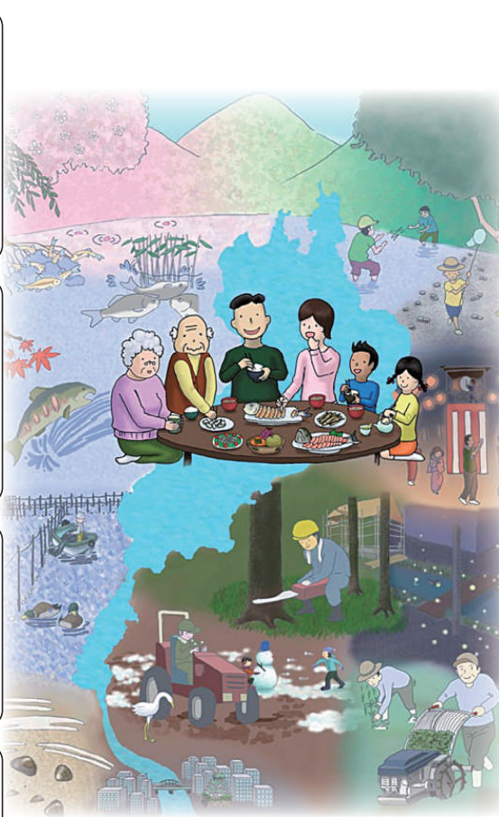
作：成安造形大学 中浜稔文 中村亮太 (2011)

冬には、えり漁を背景にカモが群れ遊び、湖辺では荒田起こしの作業の側で、サギが餌をついばむ